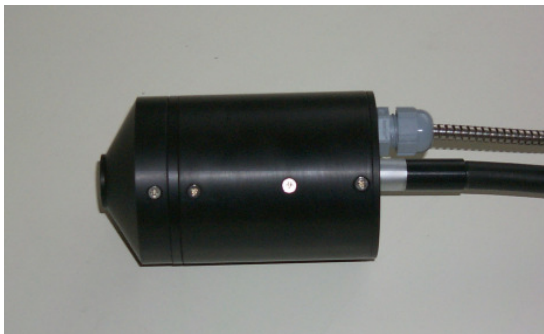
Abb. 2: Reflektorkopf für Farbmessungen

Detektortyp: Silizium-Photodiodenarray Diodenzahl: 1024 Diodengröße: 25 x 2500 µm Detektorlänge: 25,6 mm Messbereich: 200 - 1000 nm Bestrahlungsstärke bei Sättigung: 180 mW*s (typisch) Digitale Auflösung: 12 Bit Max. Dynamik: 10 5 :1 mit 3 Messungen Gleichförmigkeit der Empfindlichkeit: +/- 3% (typisch) Dunkelsignal: < 0.45% (20 °C; t l = 0.6 sec) Interface: USB