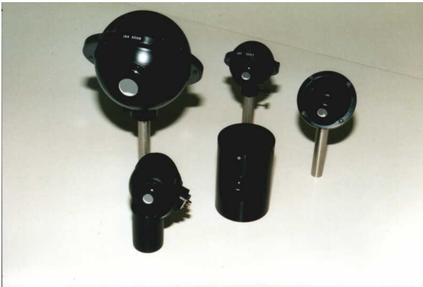
Abb. 1: Kleine Ulbricht-Kugeln

Ulbricht-Kugeln verteilen einfallendes Licht durch diffuse Reflexion gleichmäßig über die innere Kugeloberfläche. Sie werden in verschiedenen messtechnischen Anwendungen zur Integration von Strahlung und als Quelle gleichmäßiger diffuser Strahlung eingesetzt.