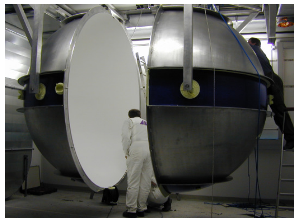
Abb. 2: Installation einer 2,5 m Ulbrichtkugel in der Physikalisch-Technischen Bundesanstalt (PTB)