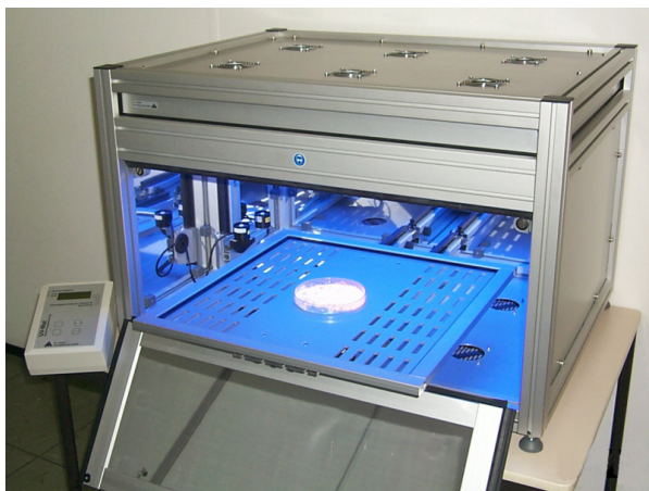
Abb. 1: UV/VIS-Bestrahlungskammer BS-04 mit Dosissteuerung UV-MAT

Die Bestrahlungskammer BS-04 ist eine große, robuste Anlage zur zeit- oder dosisgesteuerten gleichmäßigen Bestrahlung von Proben mit UV oder sichtbarem Licht. Die Kammer kann zum Erreichen hoher Bestrahlungsstärken vollständig für einen der Spektralbereiche UV-C, UV-B, UV-A oder Tageslicht D65 ausgerüstet werden. Ein besonders flexibler Einsatz ist mit dem Einbau zweier getrennt steuerbarer Spektralbereiche möglich. Der Bestrahlungsraum hat eine Grundfläche von 60x60 cm und eine Höhe von 28 cm.