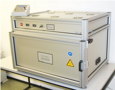
Abb. 1: UV/VIS-Bestrahlungskammer BS-04 mit Dosissteuerung UV-MAT

Die Bestrahlungskammer BS-04 ist eine große, robuste Anlage zur zeit- oder dosisgesteuerten gleichmäßigen Bestrahlung von Proben mit UV oder sichtbarem Licht. Die Kammer kann zum Erreichen hoher Bestrahlungsstärken vollständig für einen der Spektralbereiche UV-C, UV-B, UV-A oder Tageslicht D65 ausgerüstet werden. Ein besonders flexibler Einsatz ist mit dem Einbau zweier getrennt steuerbarer Spektralbereiche möglich. Der Bestrahlungsraum hat eine Grundfläche von 60x60 cm und eine Höhe von 28 cm.